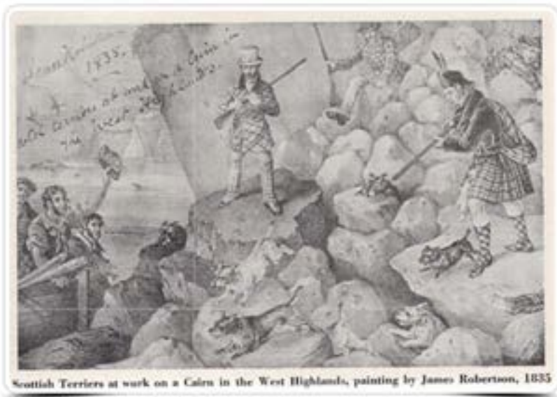
Scottish Terriers at work on a Cairn in the West Highlands, painting by James Robertson, 1835

El Scottish Terrier tiene una historia interesante que se remonta a varios siglos atrás en las Highlands de Escocia. Como su nombre lo dice, estos perros escoceses son conocidos también como "Aberdeen Terrier" llamadas así en reconocimiento a la Ciudad escocesa "Aberdeen" donde los criaban o también conocidos simplemente como "Scotties" con referencia a su nacionalidad.